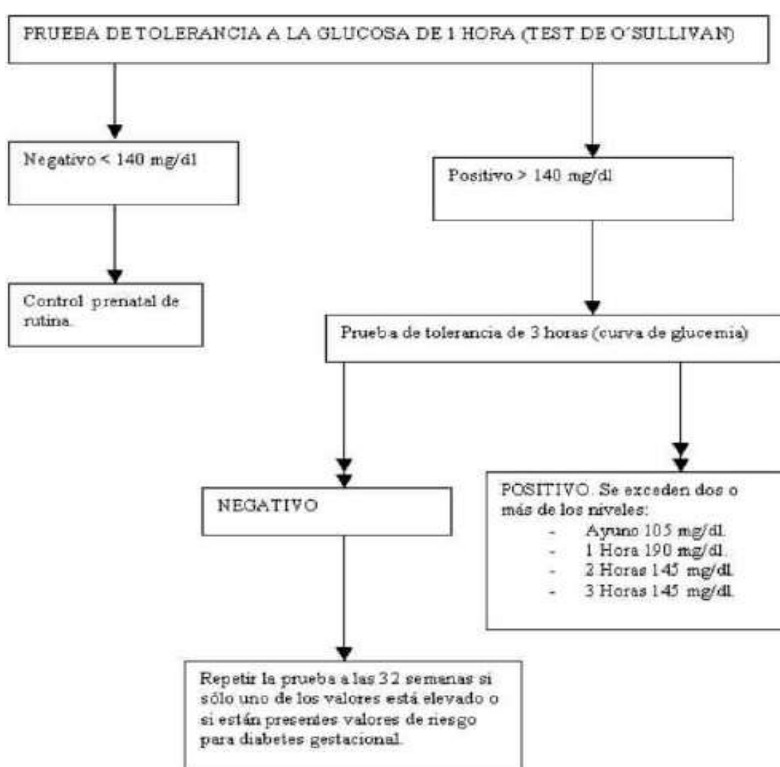
Figura 1. Screening D. Gestacional