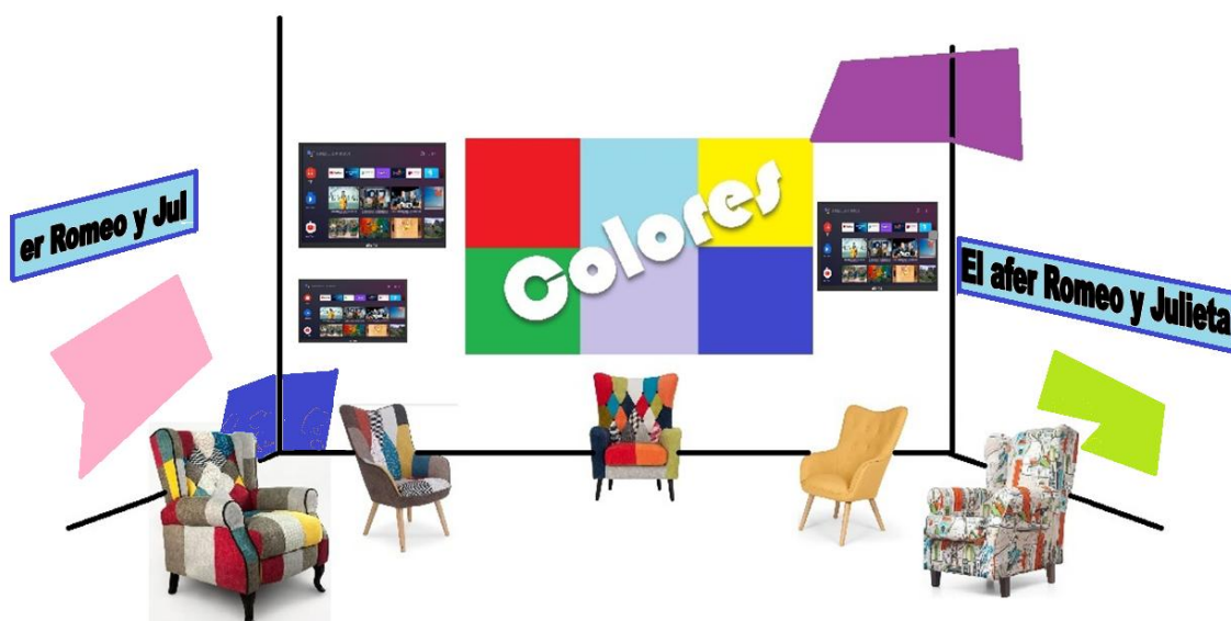
Idea para el decorado